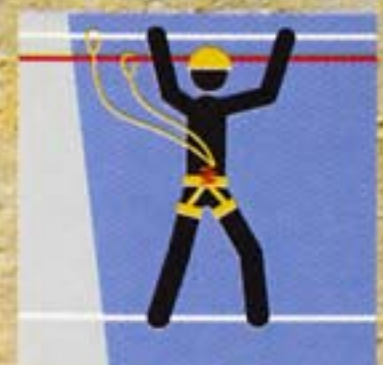
Pont de singe

Passage en tyrolienne sur câble supérieur pour personnes de petite taille.